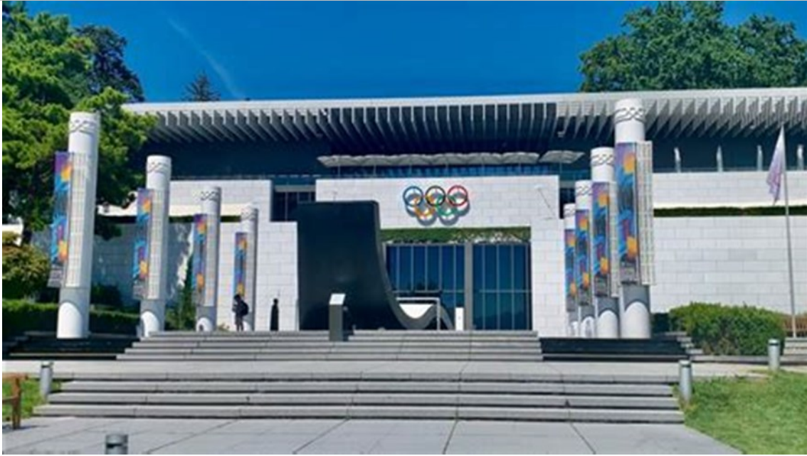
洛桑奥林匹克博物馆

满怀对神无限的感恩，我们将在二月份农历新年过后不久推出首次中文「门徒训练第一册」在线课程。现在，INSTE 课程的所有 28 本教科书都有了中文版，也包括超越学术和远程领导者培训手册。虽然还需要大量的编辑、校对和试用工作，但我们相信神会让我们能够在网上提供中文课程，就像我们提供英文和西班牙文课程一样。INSTE 网站现在也有繁体和简体中文。